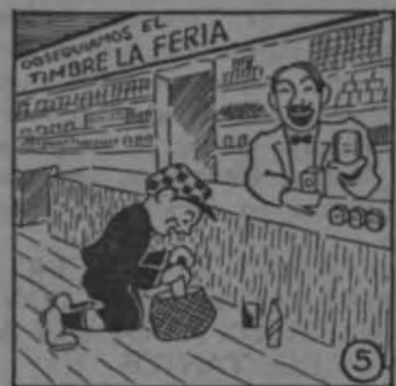
Allí compra Juanito toda la mercadería, y sale para su casa encantado, con una buena cantidad de TIMBRES LA FERIA.